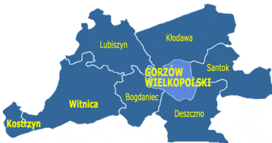
Rys. 1. Położenie gminy Kłodawa na tle powiatu gorzowskiego.

Gmina Kłodawa położona jest w północnej części województwa lubuskiego. Od strony północnej Gmina graniczy z Gminą Barlinek i Nowogródek Pomorski, od zachodu z Gminą Lubiszyn, od południa z miastem Gorzów Wielkopolski i gminą Santok, a od wschodu z Gminą Strzelce Krajeńskie.